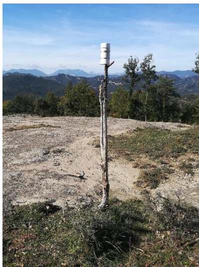
Figura 2. Instalación de un SQM para la medición de la calidad del cielo nocturno (Diputació de Barcelona)

exterior que debe ubicarse en un punto elevado y sin obstáculos ni puntos de iluminación exterior en la vertical del mismo para contar con una visión de la cúpula celeste adecuada.