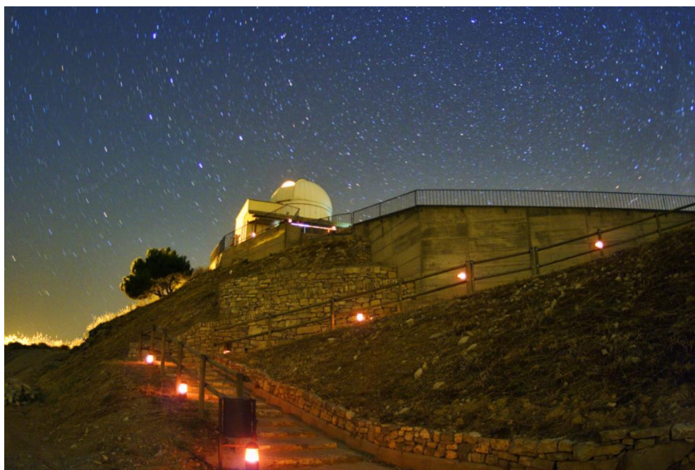
Figura 7. ECNQ en Sant Mateu de Bages – Observatori de Castellallat (Generalitat de Catalunya)