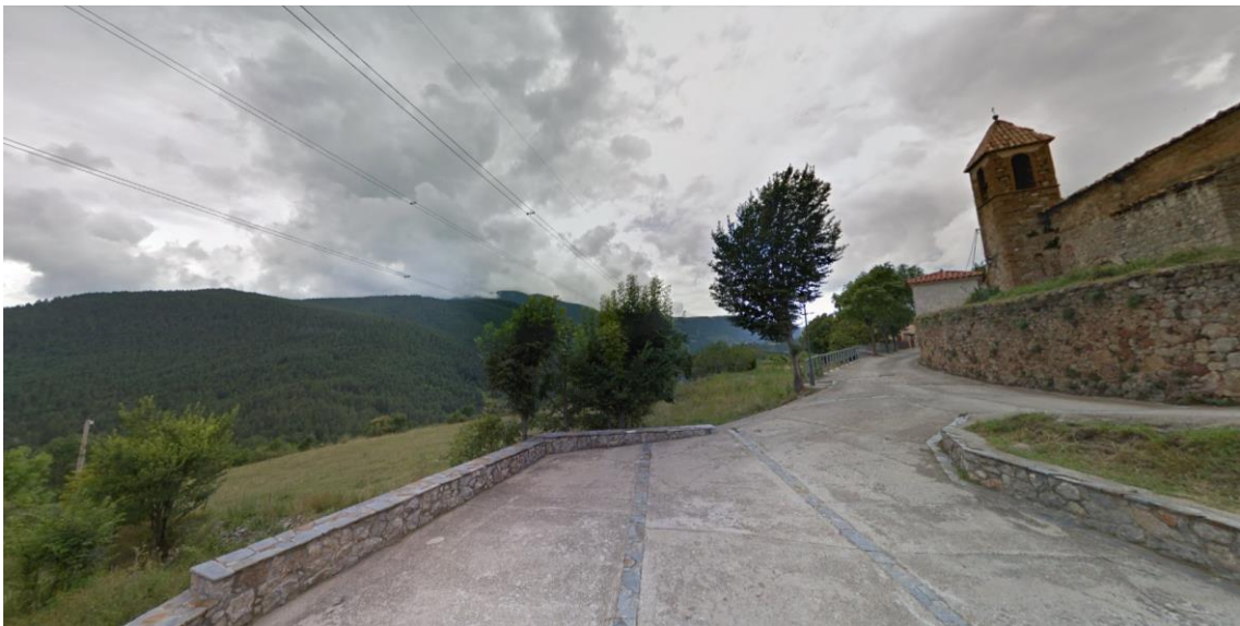
Figura 5. ECNQ en Saldes – Plaça de l'Espà, vista diurna (Google Street, 2014)