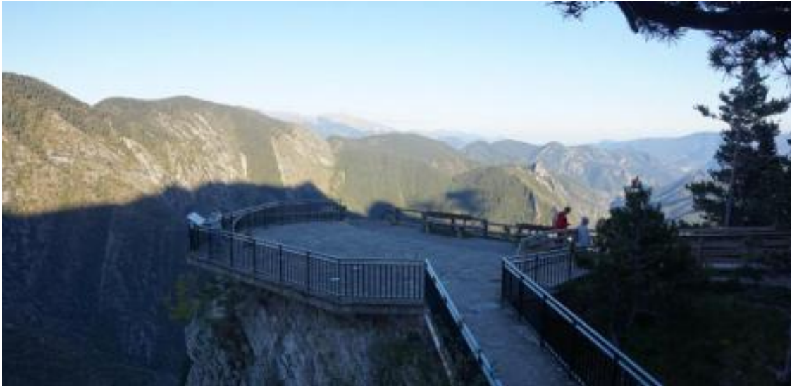
Figura 4. ECNQ en Saldes – Mirador de Gresolet, vista diurna