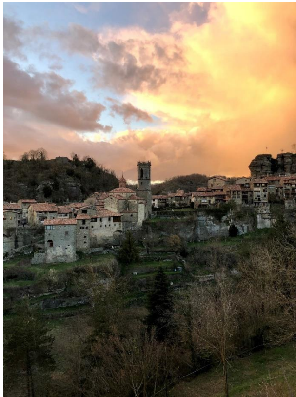
Figura 6. ECNQ en Rupit i Pruit – Vistas al núcleo urbano des de la Ermita de Santa Magdalena (Pablo Cifuentes, Diputació de Barcelona)